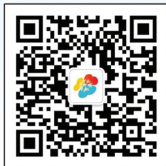
雪绒花微信二维码 “雪绒花-心理”