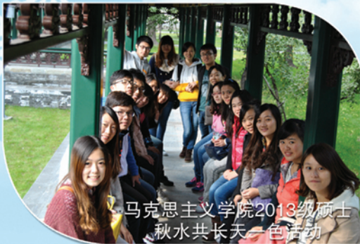
马克思主义学院2013级硕士 秋水共长天一色活动