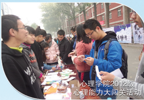
心理学院2012级 心理能力大闯关活动