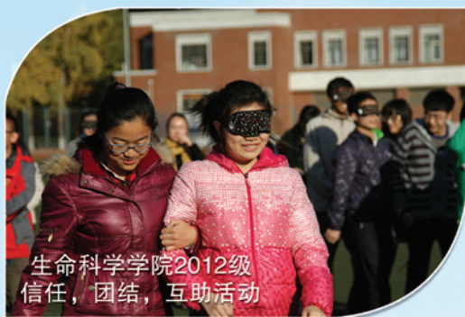
生命科学学院2012级 信任，团结，互助活动