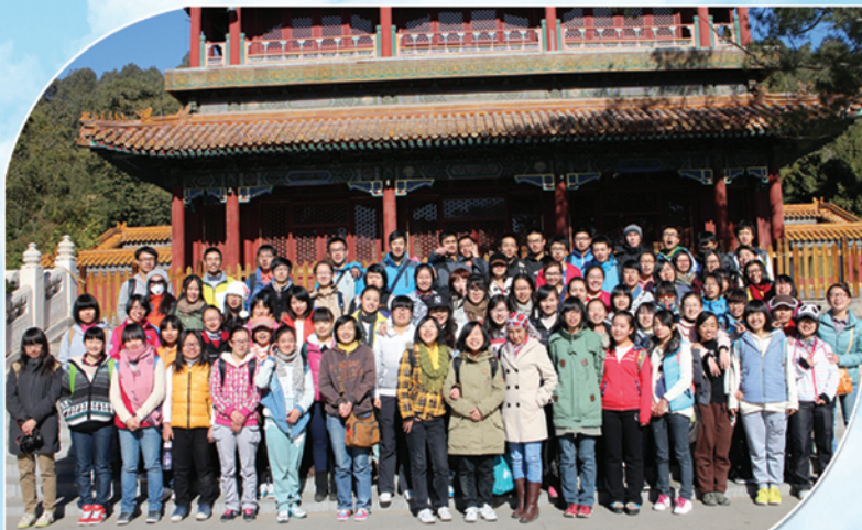
地遥学院2010级景山行，地理情，欢乐心活动