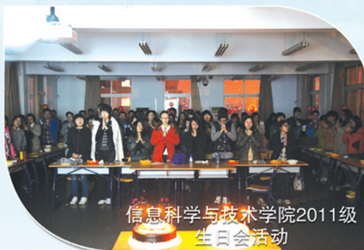
信息科学与技术学院2011级 生日会活动