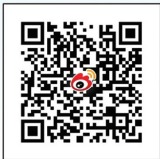
雪绒花微博二维码 “北师雪绒花心理”

更多活动详情请关注学生心理咨询与服务中⼼网站（ http://xueronghua.bnu.edu.cn ）和官方微博“雪绒花—心理”，及时了解相关动态！