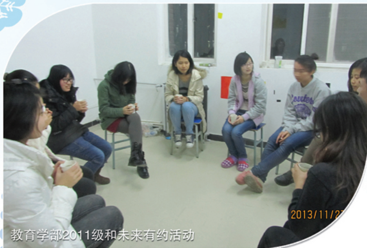
教育学部2011级和未来有约活动