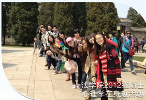
法学院2012级硕士 心理学在身边活动