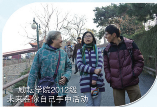
励耘学院2012级 未来在你自己手中活动